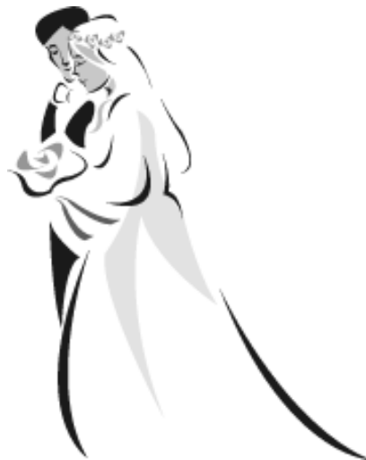
Kainova manželka? Otázka, na kterou mnoho křesťanů neumí odpovědět.

Bible jednoznačně říká, že pouze Adamovi potomci mohou být spaseni. Římanům 5 učí, že hřešíme proto, že zhřešil Adam. Odsouzení k smrti, kterého se Adamovi dostalo za jeho vzpouru, zdědili i všichni jeho potomci.